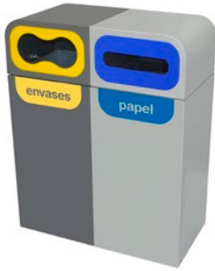
Adhesiva Nombre Residuo