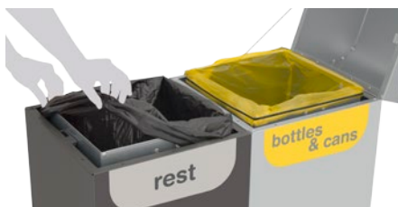
Cubetos interiores con bolsas