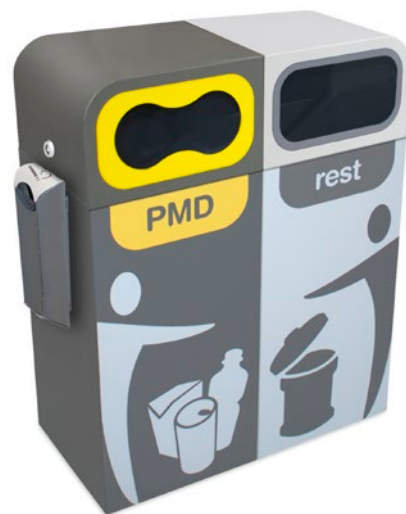
Ceniceros Kaizen 1 l. y Valencia 2 l.