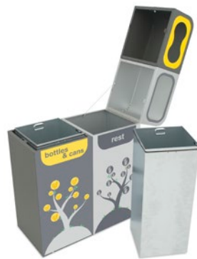
Bruselas Abierta con Cubeto Metálico